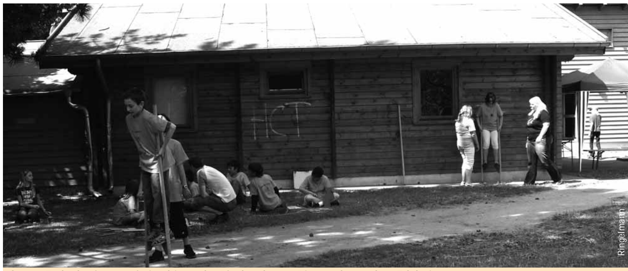
Gegen Ende der Sommerferien bietet das „Südstadtcamp“ immer besondere Erlebnisse