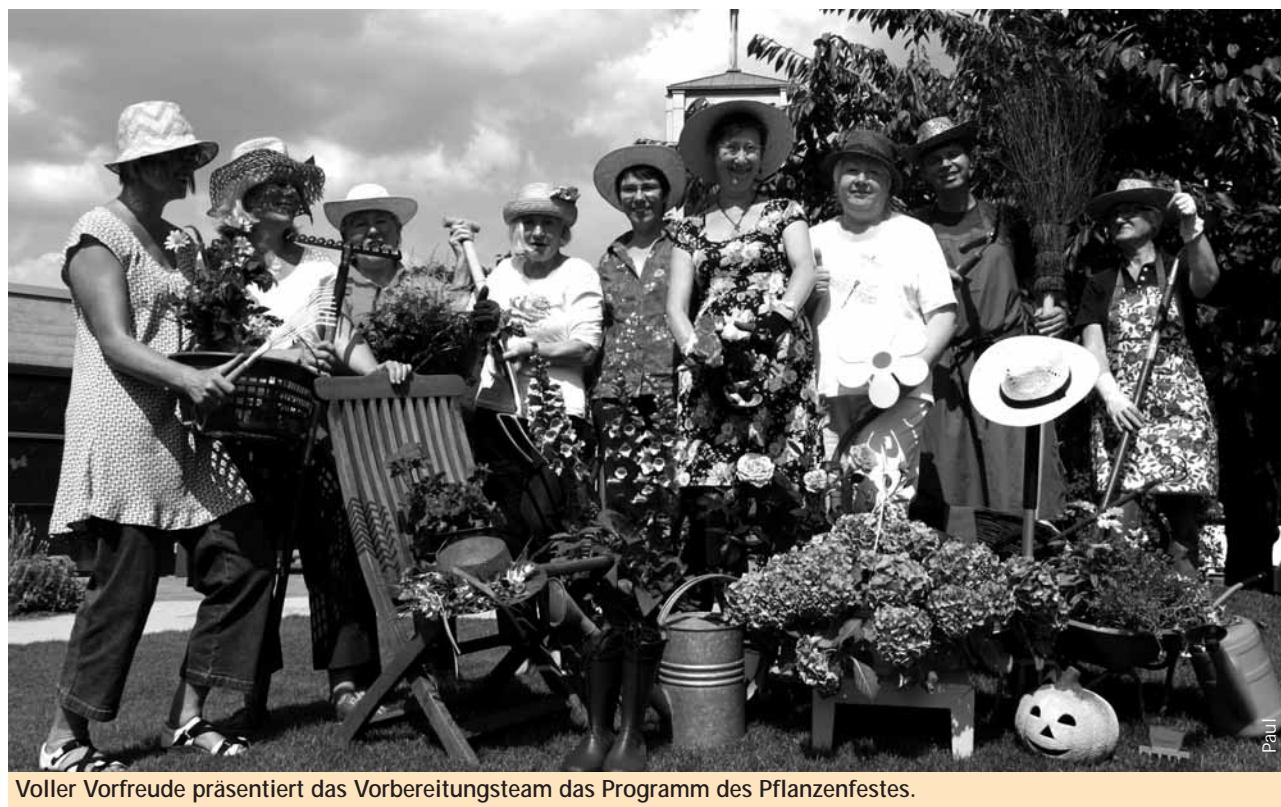
Voller Vorfreude präsentiert das Vorbereitungsteam das Programm des Pflanzenfestes.