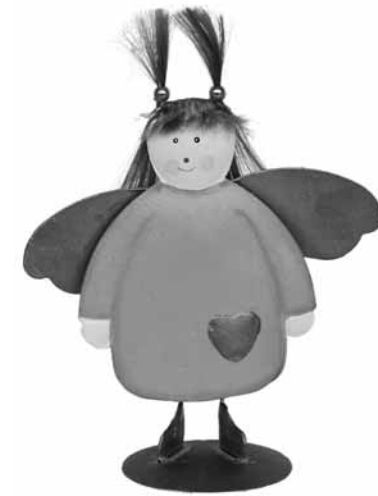
Dieser Engel ist unser Zeichen für die „Helfenden Engel“.

zenten werden Informationen zum Verlauf der Demenz insbesondere im Hinblick auf diagnostische und therapeutische Maßnahmen, zum Umgang mit den besonderen