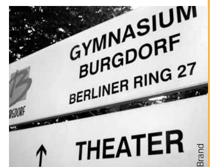
Der rote Teppich verwandelt die Aula am Berliner Ring in ein Theater.